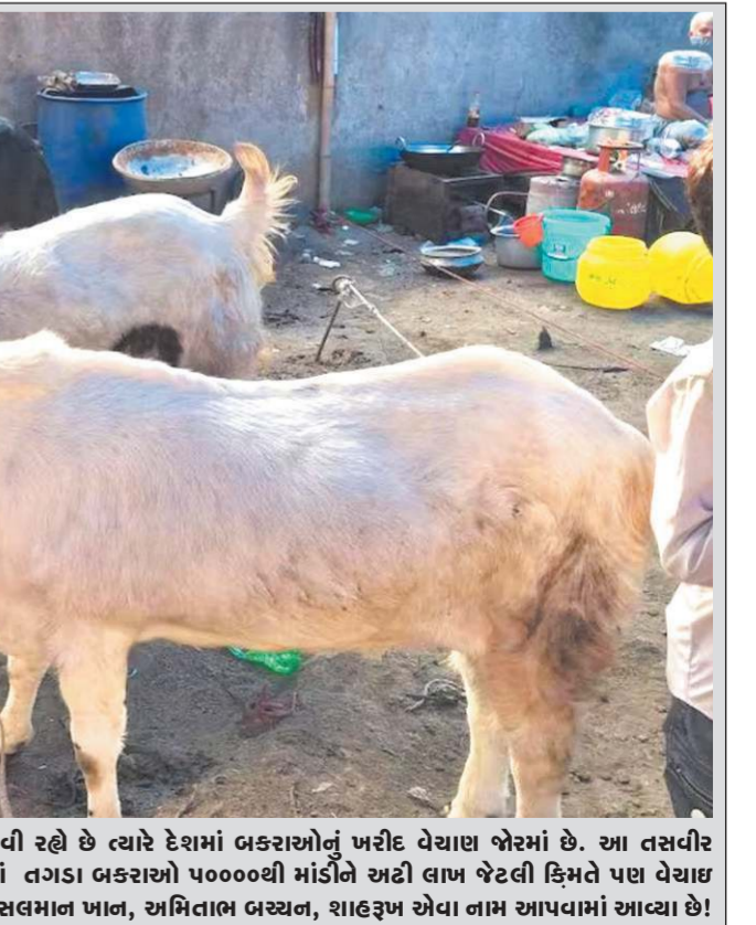
ઈલ ઈલ અગ્રહાનો તહેવાર નજીક આવી રહ્યો છે ત્યારે દેશમાં બકરાઓનું ખરીદ વેચાણ જોરમાં છે. આ તસવીર બિહારના એક બકરા બજારની છે જ્યાં તગડા બકરાઓ ૫૦૦૦થી માંડીને અટ્ટી લાખ જેટલી કિંમતે પણ વેચાઈ રહ્યો છે અને અહીં કેટલાક બકરાઓને સલામત ખાન, અમિતાભ બચ્ચન, શાહરૂખ એવા નામ આપવામાં આવ્યા છે!

નાની કંપનીઓના શેરમાં હેરાફેરી કરવા માટે ટેલિગ્રામ, વોટ્સએપ અને X નો ઉપયોગ કર્યો હતો. સેબીનો આરોપ છે કે જૂથે સોશિયલ મીડિયા એકાઉન્ટ્સ દ્વારા સ્ટોક મેનિપ્યુલેશન શેર કરી હતી જ્યારે કોલ્સ જાહેરમાં પ્રસારિત થયા પહેલા તે જ શેરમાં પોઝિશન લીધી હતી. નિયમનકારના જણાવ્યા મુજબ, તેની સર્વેલન્સ સિસ્ટમ્સે સ્ટોકસને પ્રોત્સાહન આપતી પોસ્ટ્સ, ખાસ કરીને SME પ્લેટફોર્મ પર સૂચિબદ્ધ કંપનીઓ સાથે જોડાયેલી શંકાસ્પદ ટ્રેડિંગ પ્રવૃત્તિ શોધી કાઢી હતી. સેબીએ જણાવ્યું હતું કે, વ્યક્તિઓએ ભલામણો આનવાઈન પ્રકાશિત કરતા પહેલા ઓછી લિક્વિડિટી કાઉન્ટરમાં શેર ખરીદ્યા હતા અને બાદમાં છૂટક ભાગીદારીથી ભાવમાં વધારો થયા પછી તેમને વેચી દીધા હતા. બજાર નિયમનકારે કોર્ટની મંજૂરી મેળવ્યા પછી 21 જાન્યુઆરીથી 24 જાન્યુઆરી, 2026 વચ્ચે તપાસ અને જપ્તીની કામગીરી હાથ ધરી હતી. તપાસ દરમિયાન, ઈલેક્ટ્રોનિક ઉપકરણો જપ્ત કરવામાં આવ્યા હતા અને નિવેદનો નોંધવામાં આવ્યા