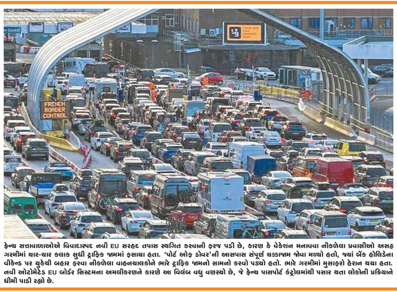
કેન્થ સત્તાવાળાઓએ વિવાદાસ્પદ નવી E.U સરહદ તપાસ સ્થાનિત કરવાની ફરજ પડી છે, કારણ કે વેકેશન મનાવવા નીકળેલા પ્રવાસીઓ અસહ ગરમીમાં ચાર-ચાર કલાક સુધી ટ્રાફિક જામમાં ફસાયા હતા. 'પોર્ટ ઓફ ડોવર'ની આસપાસ સંપૂર્ણ ચક્કાજામ જોવા મળ્યો હતો, જ્યાં બેંક હોલિડેના વીકેન્ડ પર યુકેથી બહાર ફરવા નીકળેલા વાહનચાલકોને ભારે ટ્રાફિક જામનો સામનો કરવો પડ્યો હતો. ભારે ગરમીમાં મુસાફરો દેરાન થયા હતા. નવી ઓટોમેટેડ E.U બોર્ડર સિસ્ટમના અમલીકરણને કારણે આ વિલંબ વધુ વહાલ્યો છે, જે કેન્થ પાસપોર્ટ કંટ્રોલમાંથી પસાર થતા લોકોની પ્રક્રિયાને ધીમી પાડી રહ્યો છે.

રાજકારણ શબ્દ અને ભૂલો પર જ ફ્લેક્સ હોય છે. અને રાજકારણીઓ સિવાય બીજું કોણ શબ્દો વાક્યો અને પ્રસંગોને સંપૂર્ણપણે ફેરવી નાખવામાં માહિર હોઈ શકે? કેટલીકવાર આ તેમના ફાયદા માટે હોય છે તો કેટલીકવાર તેનાથી બિનજરૂરી વિવાદો ઊભા થાય છે. આવા વિવાદો બે ભૂલથી કે અજાણતામાં પણ ઊભા થયા હોય તો તે ચૂંટણી જીતતી મીઠાશને પણ કડવાશમાં બદલી શકે છે. અને આ માટે શાસક પક્ષના ગુજરાતના એક રાજકીય નેતા સિવાય બીજા કોને હોયી કેટલી શકાય? ગુજરાત ભાજપના નેતા જગદીશ વિશ્વકર્મા દ્વારા કોંગ્રેસના સાંસદ ગેનીબેન ઠાકોરના 'પલ્લુ' (સાંડીના છેડામાંથી સત્તા સરકી જવાનો જે સંદર્ભ આપવામાં આવ્યો તેણે તેમના વિવચ પ્રવચનને એક મોટા વિવાદમાં ફેરવી નાખ્યું.