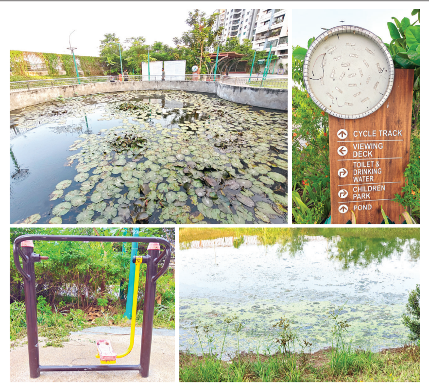
‘આજે આંતરરાષ્ટ્રીય બાયોડાયવર્સિટી ડે’