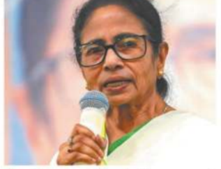
તેમણે મુખ્યમંત્રી પદેથી રાજીનામું આપવાનો ઇનકાર કર્યો છે, જેને તૃણમૂલ કોંગ્રેસ (ટીએમસી)એ 'સાંકેતિક વિરોધ' ગણાવ્યો છે અને પક્ષના નેતાઓએ સંકેત આપ્યા હતા કે લાંબી રાજકીય અને કાયદાકીય લડાઈ લડવામાં આવશે. કાલીઘાટ ખાતે આવેલા તેમના ...અનુસંધાન પાના 11 પર

ટીએમસીએ મમતાના રાજીનામા ન આપવાના નિર્ણયને લોકશાહીમાં વિરોધની એક રીત ગણાવી મમતાએ કેન્દ્ર સરકારને બંગાળમાં રાષ્ટ્રપતિ શાસન લાદવાનો પડકાર ફેંક્યો