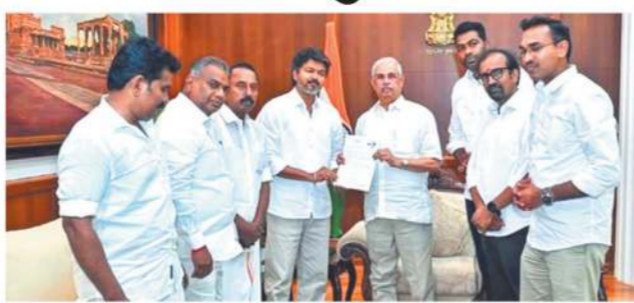
ચેન્નાઈ, તા. 6: તમિલનાડુના રાજકારણમાં છેલ્લા બે દિવસથી ચાલી રહેલી અનિશ્ચિતતાનો અંત લાવતા, અભિનેતા અને રાજનેતા વિજયે બુધવારે રાજ્યપાલ રાજેન્દ્ર આર્વેર સાથે મુલાકાત કરી સરકાર રચવાનો ઘાવો રજૂ કર્યો હતો. વિજયની નવરચિત પાર્ટી 'તમિલગા વેટ્ટરી ક્કલમ' (ટીવીકે) એ તાજેતરની વિધાનસભા ચૂંટણીમાં ડીએમકે અને એઆઈએડીએમકે જેવા દ્રવિડયન દિગ્ગજોને હરાવવાની નાખી 108 બેઠકો સાથે સૌથી મોટા પક્ષ તરીકે ઉભરી આવી છે. કોંગ્રેસે ટીવીકેને સમર્થન આપવાની જાહેરાત ...અનુસંધાન પાના 11 પર

વિજયે 112 ધારાસભ્યોની યાદી સોંપી, રાજ્યપાલે 118 ધારાસભ્યો સાથે પરત આવવા કહ્યું ચૂંટણીમાં સતત હાર બાદ એઆઈએડીએમકેના વરિષ્ઠ નેતાઓ વિજયને બહારથી ટેકો આપવાની તરફેણ કરી રહ્યા છે કોંગ્રેસે વિજયને ટેકો આપવાની બહેરાત કરી પરંતુ કોમી શક્તિઓને ગઈબંધનથી દૂર રાખવાની શરત મૂકી