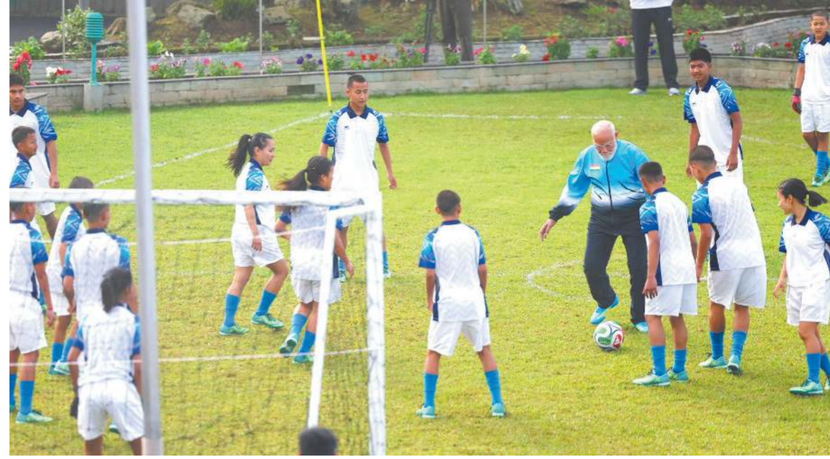
મોદી ગંગોત્રીમાં બાળકો સાથે ફૂટબોલ રમ્યા

વોશિંગ્ટન, તા. ૨૮(એપી): અમેરિકા પ્રમુખ ડોનાલ્ડ ટ્રમ્પે મંગળવારે ઘાવો કર્યો હતો કે ઈરાને અમેરિકાને હમણાં જ બાહ્ય કરી છે કે તે પતન થવાની સ્થિતિમાં છે. ટ્રમ્પે સોશિયલ મીડિયા પર પોસ્ટ કર્યું કે, તેઓ ઈચ્છે છે કે અમે જેટલી જલ્દી બને સોમ 'હોમીયુન સામુદાય'ની ખોલીએ, કારણ કે તેઓ તેમની નેતૃત્વની પદ્ધતિસ્થિતિને ઉકેલવાનો પ્રયાસ કરી રહ્યા છે. તેમણે ઉમેર્યું હતું કે તેઓ માને છે કે ઈસ્લામિક રિપબ્લિક સરકારમાં અમેરિકા સાથેની વાટાઘાટો અંગે જે મતભેદો હોવાના અહેવાલ છે, તેને તેઓ ઉકેલવામાં સક્ષમ રહેશે. ઈરાન તરફથી આ સંદેશ કોણે આપ્યો, અમેરિકાના રિપબ્લિકન વહીવટીતંત્રમાં તે કોને મળ્યો અને આ સંપર્ક સીધો અમેરિકા સાથે થયો હતો કે કોઈ મધ્યસ્થી દ્વારા, તેવા પ્રશ્નો પર વ્હાઈટ હાઉસે તરત જ કોઈ પ્રતિસાદ આપ્યો ન હતો.