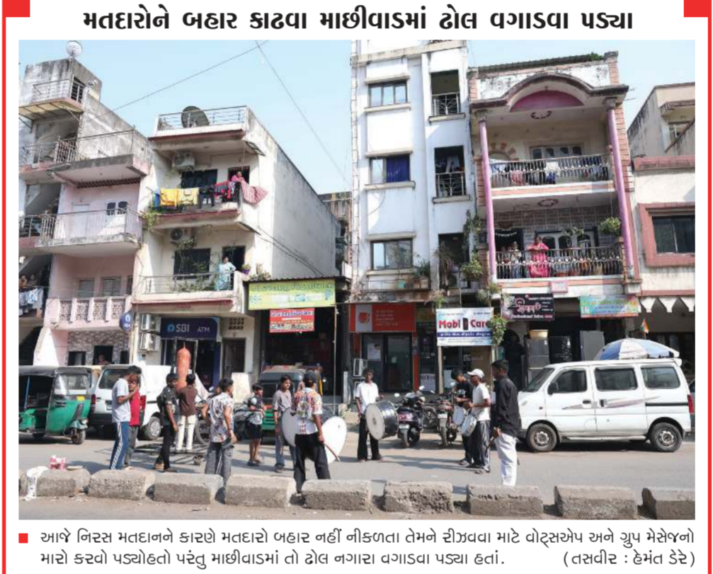
મતદારોને બહાર કાઢવા માછીવાડમાં ઢોલ વગાડવા પડ્યા

સીધી ટક્કર થઈ કેમ કે આ બધા વિસ્તારોમાં કોંગ્રેસના ટેબલ પણ જવલ્લેજ જોવા મળ્યા હતા. જયારે બીજા બાજુ લઘુમતિ વિસ્તારોમાં અને કોટ વિસ્તારોમાં કોંગ્રેસના કાર્યકરો અને નેતાઓ મહેનત કરતાં જણાયા હતા. આ વિસ્તારોમાં આમ આદમી પાર્ટી ચિત્રમાં ના હોય તેવી પ્રતિતિ લધુ છે.