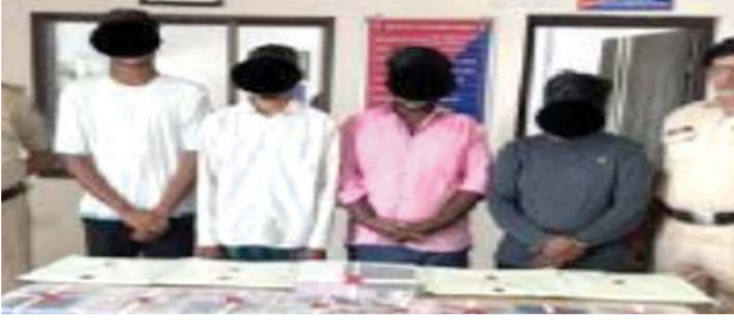
પોલીસે આરોપીઓ પાસેથી મોટો મુદામાલ કર્યો કબ્જે

દમણ પોલીસે આરોપીઓ પાસેથી કુલ 13.38 લાખનો મુદામાલ જપ્ત કર્યો