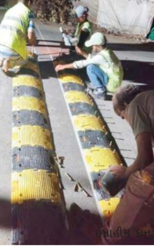
ભારેબમ અને ઓવરલોડેડ વાહનોની સતત અવરજવર રહે છે. ગીચ વસતી હોવા છતાં અહીં ગતિ મર્યાદા પર કાબૂ રાખવા માટે કોઈ વ્યવસ્થા નહોતી. છેલ્લા થોડા જ સમયમાં અહીં સર્જાયેલા વિવિધ અકસ્માતોમાં ૭થી વધુ લોકોએ પોતાના જીવ ગુમાવ્યા હતા. સ્થાનિકોએ અવારનવાર બમ્પ મુકવા રજૂઆતો કરી હતી, પરંતુ તંત્રની નિષ્ક્રિયતાને કારણે લોકોમાં ભારે રોષ હતો.

તાજેતરમાં જ પિતા-પુત્રી અને મજૂરનું મોત થતાં લોકોએ વિરોધ નોંધાવ્યો હતો