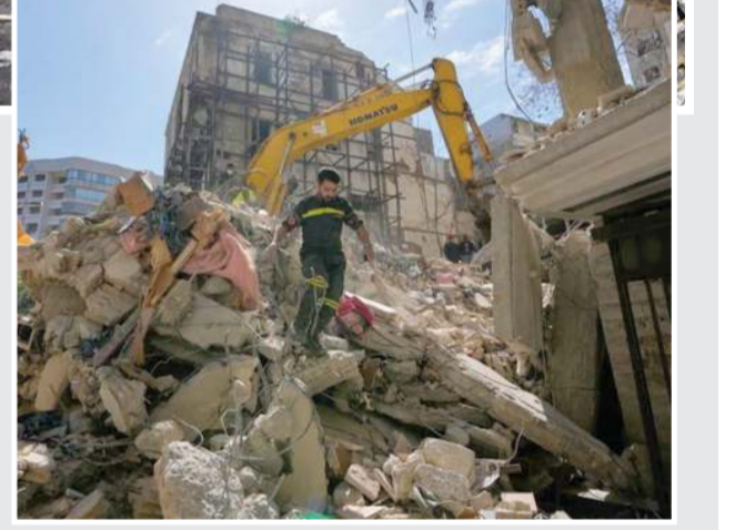
... અનુસંધાન પાના ૧૫ પર

બેરૂત, ૯ (AP): ઈઝરાયેલ દ્વારા બુધવારે લેબેનોનમાં હુમલાઓ તેજ કરવામાં આવ્યા હતા, જેમાં બેરૂતના વ્યાપારી અને રહેણાંક વિસ્તારોને નિશાન બનાવવામાં આવ્યા હતા. અહીં લડાઈના સૌથી ઘાતક દિવસે ઓછામાં ઓછા ૨૦૦ લોકો માર્યા ગયા હોવાનો દાવો લેબેનોનના આરોગ્ય મંત્રાલય દ્વારા કરવામાં આવ્યો હતો, સાથે જ કહેવાયું હતું કે આ હુમલાઓમાં ૧૦૦૦થી વધુ લોકો ઘાયલ થયા છે. અલ જઝીરા નેટવર્ક અને ત્યાંના આરોગ્ય અધિકારીઓના જણાવ્યા અનુસાર, બુધવારે થયેલા ઈઝરાયેલી હુમલામાં ગાઝામાં અલ જઝીરાના એક સંવાદદાતાનું મોત થયું છે. આ ઉપરાંત, 'કમિટી ટુ પ્રોટેક્ટ જર્નાલિસ્ટ્સ' અને સંબંધિત ન્યૂઝ નેટવર્ક અનુસાર, લેબેનોનમાં પણ તે દેશના બે પત્રકારો ઈઝરાયેલી હુમલામાં માર્યા ગયા છે. ભીષણ ઈઝરાયેલી હુમલા બાદ કાટમાળ