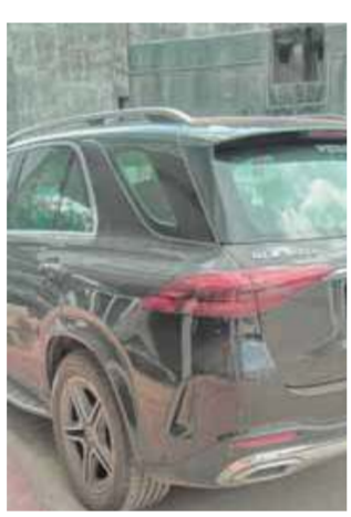
(તસવીર : અનુસંધાન પાના 5 પર)

મર્સિડીઝ ચાલકને પકડવા હોસ્પિટલનો મુખ્ય દરવાજો બંધ કરવો પડ્યો