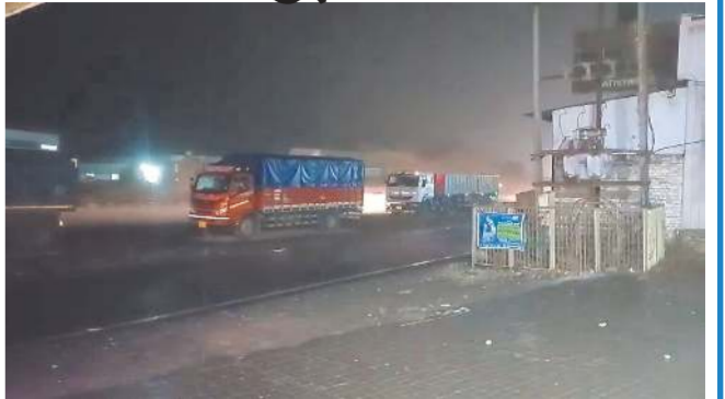
ભરતિનાળે ખેરગામ પંચકમાં માવડું

કેરી સહિતના પાકને નુકસાનની શક્યતા, ખેડૂતોમાં ચિંતા