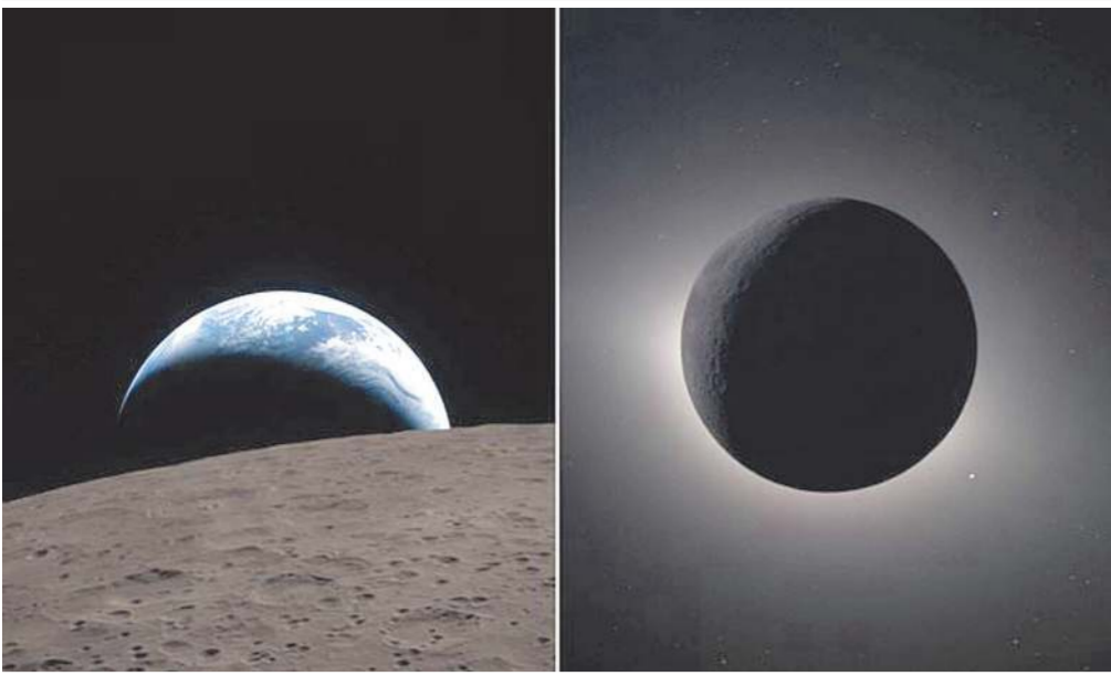
નાસાએ આર્ટિમિસ II મિશન પરથી લેવાયેલી તસવીરો બહાર પાડી