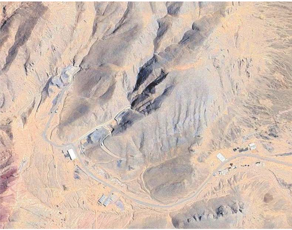
ઘરાં, તે હજુ પણ મધ્ય પૂર્વમાં તેના કોલેટ અને ડ્રોનનો ભંડાર વાપરવા માટે સક્ષમ છે. ઈન્સ્ટિટ્યૂટ ફોર ઇન્ડિયન સ્ટડીઝ ઓફ વોર (ISW)ના જણાવ્યા અનુસાર, ટૂંકમાં ઈરાન સાથેના સુદૃઢ શરૂઆતથી માત્ર યુગ્દ મિસાઈલ બેઝ પર જ ઓછામાં ઓછા છ વખત હુમલા કરવામાં આવ્યા છે, જેમાં 1 માર્ચ, 27 માર્ચ

બાંધકામ સામગ્રી કરતા અનેકગણું વધુ દબાણ સહન કરી શકે છે. આ મજબૂત પડકો અમેરિકાના સૌથી શક્તિશાળી બંધ-બંધર બોમ્બ-GBU-57 મેસિવ ઓર્ડનન્સ પેનિટ્રેટર-માટે પણ અત્યંત કઠિન અવરોધ ઊભો કરે છે. પહાડની અંદરના ભાગને એવી રીતે કોતરવામાં આવ્યો છે કે તે લશ્કરી મથકને બદલે કોઈ છુપાયેલા શહેર જેવું લાગે છે. એવું માનવામાં આવે છે કે આ ગુમ સુવિધામાં એક સ્વચાલિત રેલ સિસ્ટમ છે, જે ટનલ દ્વારા એકેમબલી એરિયા, સ્ટોરેજ ડેપો અને પહાડની ખુદી ખુદી સપાટીઓ પર આવેલા અનેક છુપાયેલા પ્રવેશદ્વારોને જોડે છે. ઈરાની પ્રચાર વીડિયોમાં જોવા મળતા આ પ્રકારના અન્ય ભૂગર્ભ 'મિસાઈલ શહેરો'ની જેમ, અહીં પણ લોન્ચર્સને ટૂંક પર ઝડપથી ફેરવવામાં આવે છે, ફાયરિંગ માટે બહાર લાવવામાં આવે છે અને પલકવારમાં મજબૂત સશસ્ત્ર દરવાજાઓની પાછળ ફરીથી ભૂગર્ભમાં ખેંચી લેવામાં આવે છે.