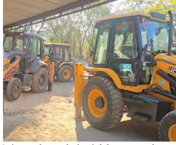
ઉપરોક્ત તસવીરમાં ઝડપી પાડેલા જેસીબી દ્રશ્યમાન થાય છે

જેસીબી મશીનો કેબલ નાખવાની કામગીરી કરતા હતા