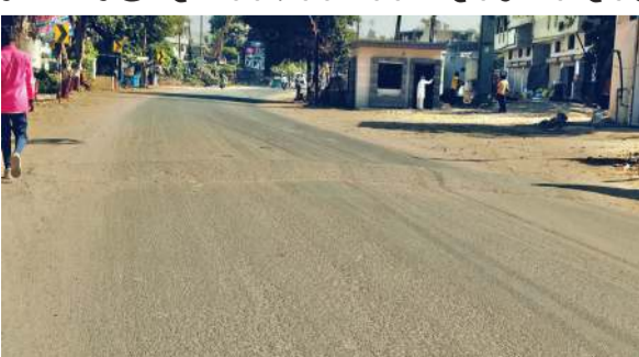
ઉપરોક્ત તસવીરમાં સ્પીડ બ્રેકર પર પટ્ટા લગાવવાનું ભૂલી ગયા તે દ્રશ્યમાન થાય છે

રોડ પર સ્પીડ બ્રેકર લગાવ્યા બાદ પટ્ટા મારવાનું ભુલી ગયા