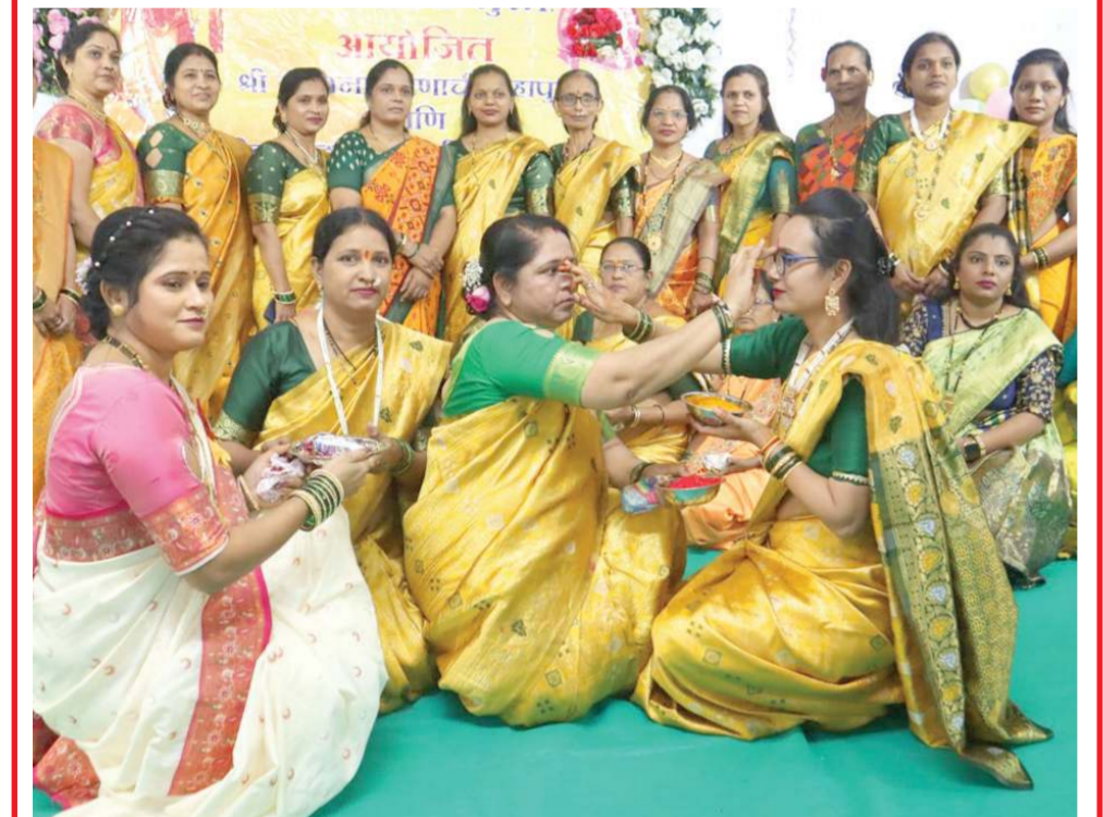
મહાદેવીની પરંપરા મુજબ સુરતમાં રહેતા બાલકો ગ્રામસ્થ મંડળ ભટારગોડા કોમ્યુનિટી હોલ ખાતે હલ્દી-કંકુ મહોત્સવ ઉજવ્યો હતો. આ સમાજની મહિલાઓએ એકબીજાને હલ્દી અને કંકુનું તિલક કર્યું હતું.