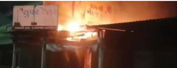
ધુમાડાના ગોટેગોટા ઉડતા લોકોના જીવ તાળવે ચોંટ્યા

ઇલેક્ટ્રિક શોર્ટ સર્કિટને કારણે બનાવ બન્યો કરજણ જૂના બજારમાં સલૂનમાં આગ લાગતા અફરાતફરી મચી