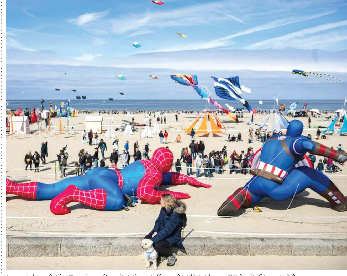
ફ્રાન્સના બર્ક-સુર-મેરમાં 37મા આંતરરાષ્ટ્રીય પતંગ મહોત્સવ દરમિયાન એક મહિલા બીચ પર લોકોને પતંગ ઉડાવતા જુએ છે

વોશિંગ્ટન, તા. 24 : અમેરિકન સ્પેસ એજન્સી નાસાના અવકાશયાન વોયેજર-1એ 24 અબજ કિલોમીટર દૂરથી સિગ્નલ મોકલ્યા છે. છેલ્લા 5 મહિનામાં આ પ્રથમ વખત છે જ્યારે વોયેજરે સંદેશ મોકલ્યો છે અને નાસાના એન્જિનિયરો તેને વાંચવામાં સફળ રહ્યા છે. વોયેજર 1ને વર્ષ 1977માં અવકાશમાં મોકલવામાં આવ્યું હતું. આ માનવ દ્વારા બનાવેલ અવકાશયાન છે જે અવકાશમાં સૌથી દૂરના અંતરે હાજર છે. આ અવકાશયાને ગયા વર્ષે 14 નવેમ્બરથી સિગ્નલ મોકલવાનું બંધ કરી દીધું હતું. જોકે, તેને પૃથ્વી પરથી મોકલવામાં આવેલા આદેશો રિસીવ કરી રહ્યું હતું. વાસ્તવમાં, ડેટા એકત્રિત કરવા અને તેને પૃથ્વી પર મોકલવા માટે જવાબદાર અવકાશયાનની ફ્લાઈટ ડેટા સિસ્ટમ લૂપમાં અટવાઈ ગઈ હતી. માર્ચમાં નાસાની ટીમે શોધ્યું કે અવકાશયાનની એક ચિપ ખરાબ થઈ ગઈ છે, જેના કારણે 3% ડેટા સિસ્ટમ મેમરી બગડી ગઈ હતી. આ કારણોસર અવકાશયાન કોઈ વાંચી શકાય તેવા સંકેત મોકલવામાં સક્ષમ ન હતું. આ પછી વૈજ્ઞાનિકોએ કોડિંગ દ્વારા ચિપને ઠીક કરી. વોયેજર દ્વારા 20 એપ્રિલે મોકલવામાં આવેલા સિગ્નલમાં તેણે તેના સ્વાસ્થ્ય અને સ્ટેટસ અપડેટ આપ્યા છે. નાસાના જણાવ્યા અનુસાર, આગળનું પગલું અવકાશયાનમાંથી વિજ્ઞાન ડેટા મેળવવાનું છે. વોયેજર-2 પછી નાસાએ અવકાશમાં અન્ય ગ્રહો શોધવા માટે વોયેજર-1 લોન્ચ કર્યું હતું. તે 5 સપ્ટેમ્બર 1977ના રોજ લોન્ચ કરવામાં આવ્યું હતું. ફેબ્રુઆરી 1990માં આ અવકાશયાને સૌરમંડળની પ્રથમ ઓવરવ્યૂ તસવીર લીધી હતી. ત્યાર બાદ 25 ઓગસ્ટ, 2012ના રોજ વોયેજર-1 ઈન્ટરસ્ટેલર સ્પેસમાં પ્રવેશ્યું હતું. પૃથ્વી પરથી સંદેશ મોકલવામાં અને પછી વોયેજર-1 પરથી સંદેશ પરત મેળવવામાં 48 કલાકનો સમય લાગે છે.