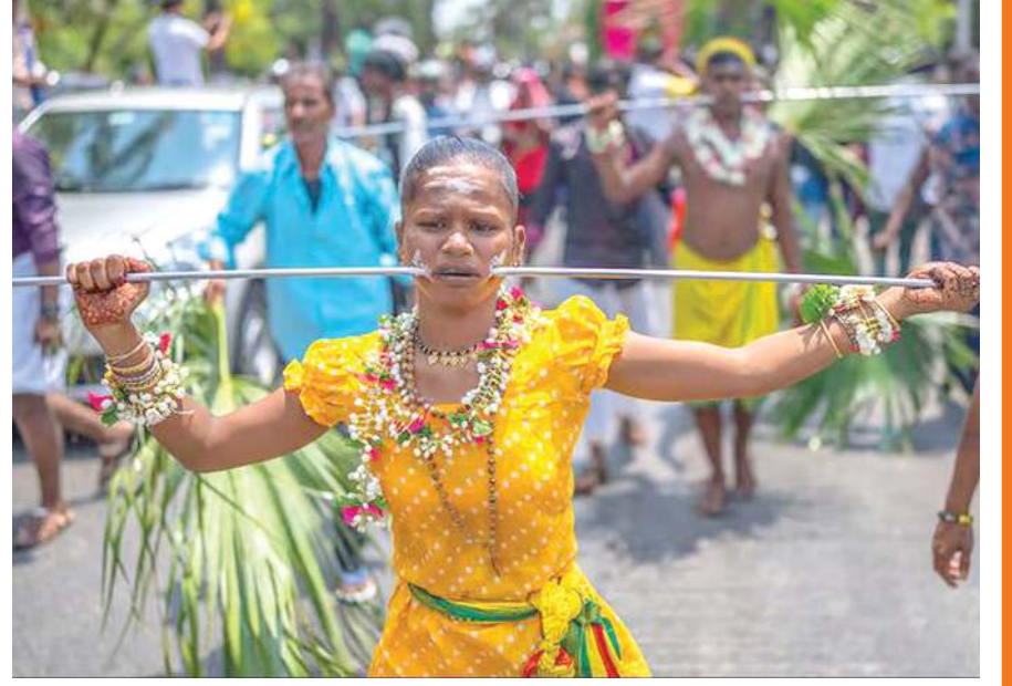
સમગ્ર ભારતમાં લોકોએ બુધવારે તમિલ હિંદુ તહેવાર 'પંગુની ઉચિરમ' ની ઉજવણી કરી હતી. પંગુની ઉચિરમ તહેવારની ધાર્મિક શોભાયાત્રામાં ભક્તો ઘાતુના ભાલાથી ગાલ વાંધે છે, પાછળ હૂક વાંધે છે અને કાર ખેંચે છે તેવા વિચિત્ર દ્રશ્યો જોવા મળ્યા હતા.