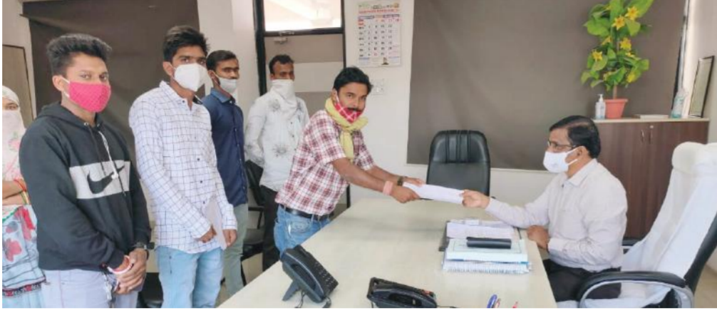
છોટાઉદેપુરમાં ગ્રામજનોએ કલેક્ટર અને ચૂંટણી અધિકારીને આવેદનપત્ર આપ્યું હતું.

ગ્રામજનો દ્વારા અગાઉ અનેક વાર રજૂઆતો કરવામાં આવી હોવા છતાં તંત્રની ઊંઘ ઊડતી નથી