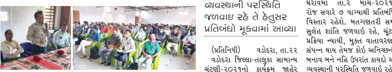
શિક્ષકો દ્વારા એસ.એસ.સીમાં અંગ્રેજીનું પરિણામ સુધારવા વિવિધ સુચનો કરવામાં આવ્યાં હતાં.

ગણિત અને વિજ્ઞાનના વિષયો પર પણ ભાર મુકવામાં આવ્યો હતો