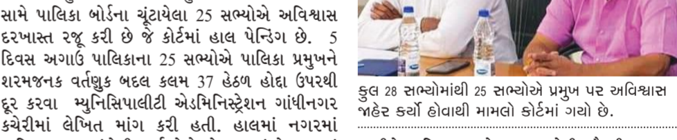
કુલ ૨૮ સભ્યોમાંથી ૨૫ સભ્યોએ પ્રમુખ પર અવિશ્વાસ જાહેર કર્યો હોવાથી મામલો કોર્ટમાં ગયો છે.

છોટાઉદેપુર નગરપાલિકા પ્રમુખ સામે અવિશ્વાસની દરખાસ્ત