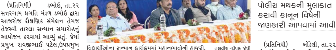
વિદ્યાર્થીઓના સન્માન કાર્યક્રમમાં મહાનુભાવોની હાજરી.

સમાજ ઉપયોગી અન્ય કાર્યો કરવાની પણ જાહેરાત થઈ